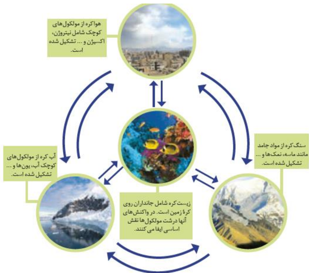
شکل ۲- زمین از دیدگاه شیمیایی پویاست و بخش های گوناگون آن با یکدیگر برهم کنش های فیزیکی و